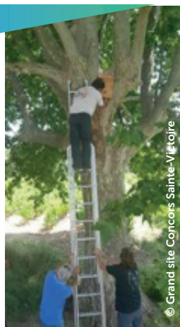
Installation d'un nichoir à chauves-souris à Puyloubier

Le SABA propose à des agriculteurs volontaires de s'engager dans une démarche de Paiements pour services environnementaux, venant rétribuer financièrement les exploitants s'engageant en faveur de l'environnement (réduction des traitements herbicides notamment, préservation et restauration de ripisylves...).