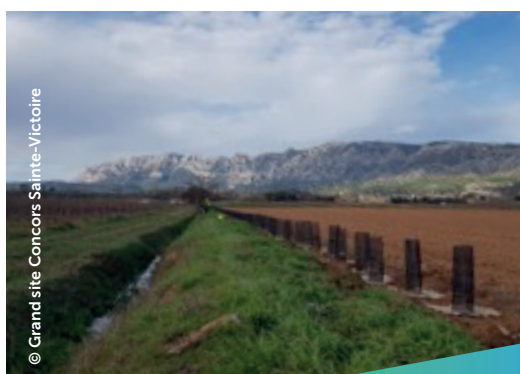
Plantation d'une haie composée de plusieurs essences - Domaine de Saint-Panrace